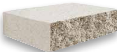
Cod. CKCOMG - Grigio