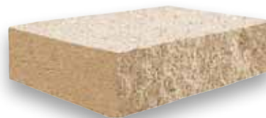
Cod. CKCOMNOC - Nocciola