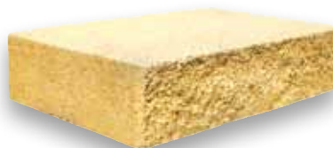
Cod. CKCOMGIA - Giallo